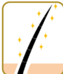
頭髪と頭皮をピュアな状態に。