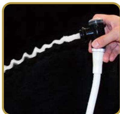
【商品名】バブスパイラルシャワーヘッド

スキャルプケアシャワーとして、炭酸タブレットを併用し全く新しい機能を備えた理美容専用のシャワーヘッドです。スパイラル水流で汚れを粉砕し、炭酸パワーで除去します。